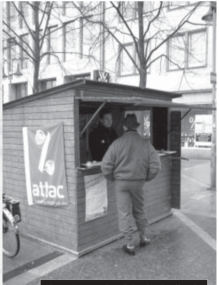
Hier am Husemannplatz, direkt neben dem Glascafe, können Sie das Bürgerbegehren unterschreiben – aber auch in unserer Geschäftsstelle.

2 Zum Beispiel verpflichtet sich die Stadt, das Kanalnetz während der gesamten Mietzeit zu erhalten und zu pflegen, also im Prinzip 99 Jahre lang. Zwar bleibt es ihr selbst überlassen, auf welche Weise sie Wartung, Instandhaltung oder Teilerstattungen vornimmt. Eine Stilllegung aber wäre zum Beispiel nicht zulässig. Das ist deshalb riskant, weil die Stadt Bochum keinerlei Einfluss auf die Gesetzgebung hat, die die Abwasserbewirtschaftung regelt: EU-Umweltgesetze beispielsweise. Auch der Stand der Technik kann sich ändern: Vielleicht entwickeln sich die Wasserrückgewinnungsanlagen so gut weiter, dass ihr Einsatz im Gebäudebereich lohnend wird und viel umweltfreundlicher ist als große Klärwerke. Dann braucht kein Mensch mehr das teure Kanalnetz im heutigen Umfang und die Stadt muss es nur noch bewirtschaften, weil sie sich gegenüber einem US-Trust dazu verpflichtet hat. Wenn Sie das für unwahrscheinlich halten: Für wie wahrscheinlich hätten Sie im Jahre 1875 eine Mondlandung gehalten?