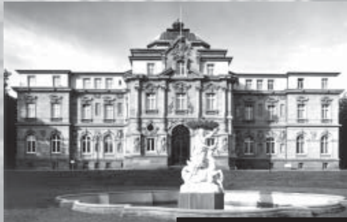
Das Palast des Bundesgerichtshofs in Karlsruhe.

einer Fußnote jedenfalls keine vertragliche Vereinbarung ist, wenn im Vertragstext selber von „gesetzlicher Frist“ die Rede ist. Zu Grunde lag der Fall eines Mietervereins-Mitglieds, das zum 1. September 2001 mit dreimonatiger Frist gekündigt hatte. Amts- und Landgericht hatten den auf Zahlung klagenden Vermieter abgewiesen und dies auch juristisch fundiert begründet.