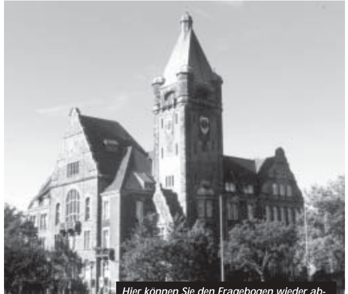
Hier können Sie den Fragebogen wieder abgeben – aber auch an vielen anderen Orten!

Alle Hattinger Mitglieder finden den Fragebogen in der Mitte dieses Heftes – zum Ausheften, Ausfüllen und Abgeben bei uns! Nebenan noch einige technische Hinweise.