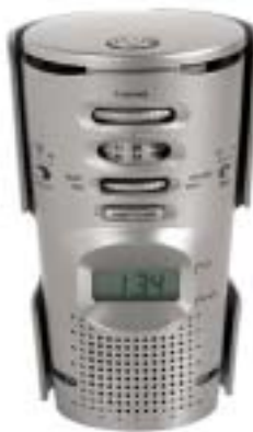
4 Slide away