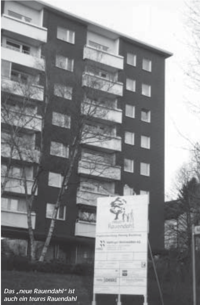
Das „neue Rauendahl“ ist auch ein teures Rauendahl