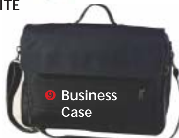
9 Business Case