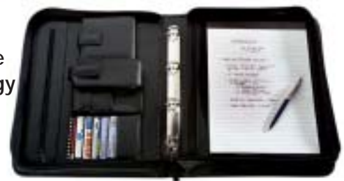
10 Multiple Synergy